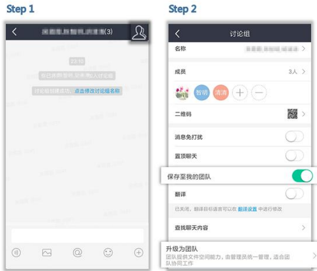
图 11 管理群组及升级为团队

点击消息界面右上角的“+” > “创建群聊”，即可创建群聊（如图 10 所示）。点击群聊界面右上方的头像，在设置页面可以管理临时群组，包括新增或删除成员、移交管理员、解散该群等。临时群组还可以升级为团队，管理起来更方便（如图 11）。