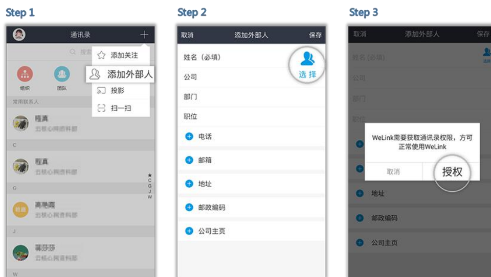
图 6 外部联系人