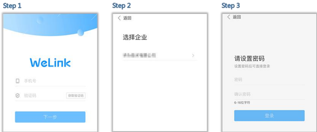
图 1 首次登录 WeLink

选择企业(太原工业学院)后,设置登录密码,即可登录 WeLink (如图 1 所示)。