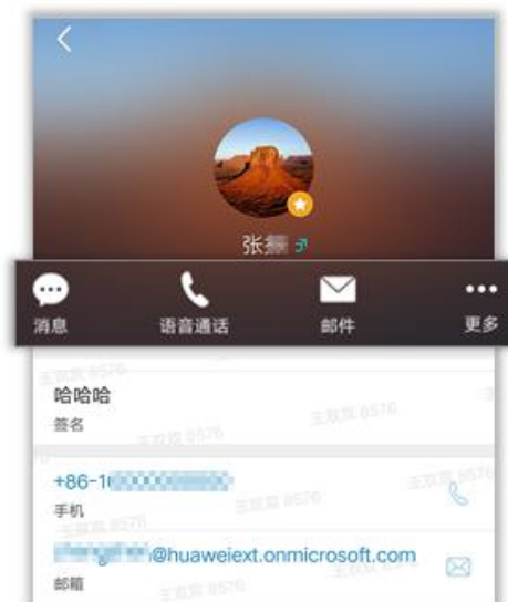
图 2 丰富的沟通方式

可快速查找同事,建立多途径工作沟通。在通讯录页面可以查看组织架构、团队,可以和联系人通过 IM、语音通话、邮件等丰富的沟通方式,随时随地建立协同连接(如图 2 所示)。