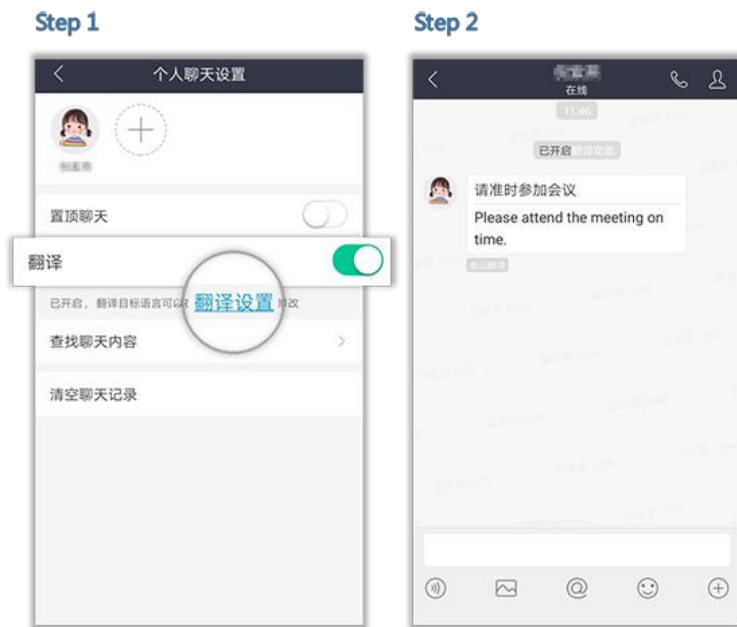
图 8 自动翻译

在和某个联系人聊天页，点击右上方的联系人头像，在“个人聊天设置”页面开启翻译功能并设置好目标语言，即可实现实时翻译。如图 8 所示。