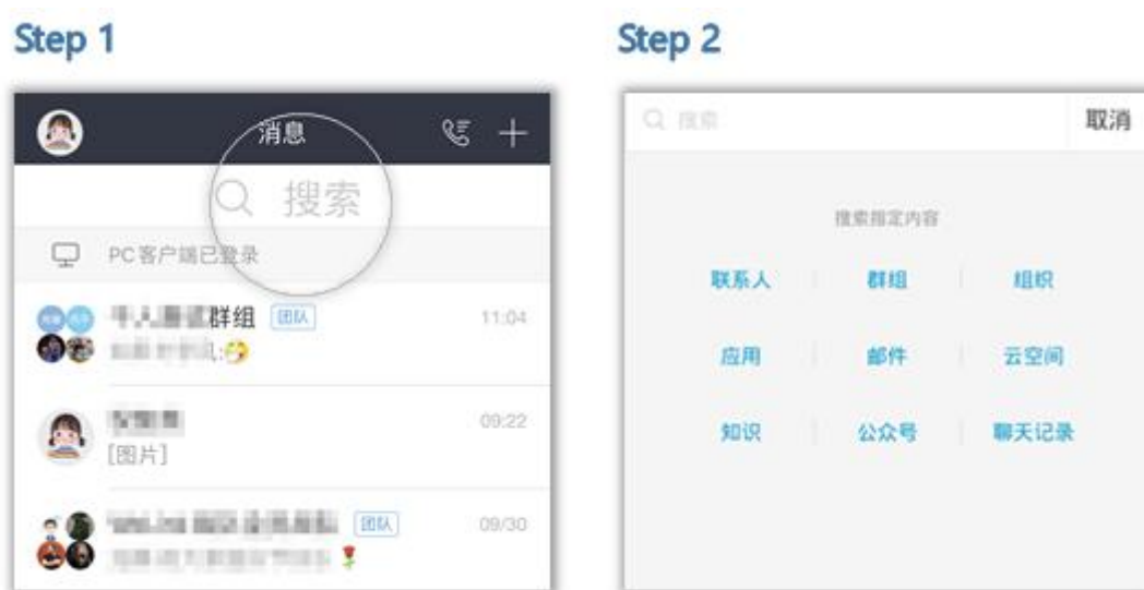
图 7 智能搜索